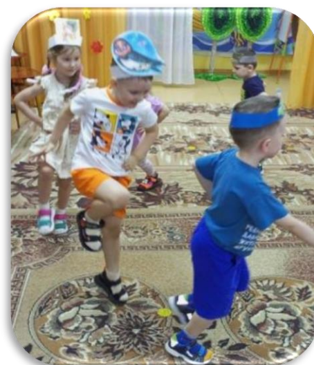
Подвижная игра «Птички в гнёздышке»

Была проведена экологическая беседа с мультимедийным сопровождением «Берегите птиц». Дети узнали о зимующих и перелетных птицах, как