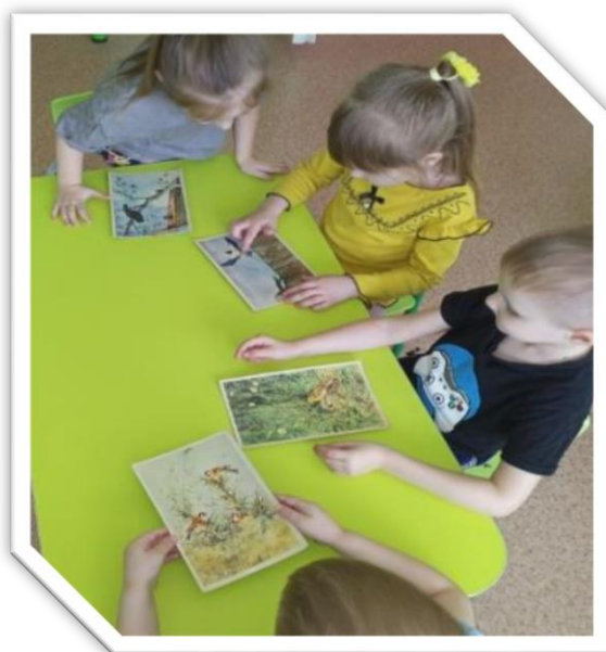
Дидактическая игра «Какая птица улетела»

Дети узнали об истории праздника, о пользе птиц, их роли в природе и жизни человека. Дошколята слушали аудиозаписи с голосами птиц, играли в дидактические и подвижные игры «Какая птица улетела», «Перелетные и зимующие птицы», «Летает – не летает», «Птички в гнёздышке».